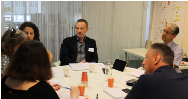
Studiile de caz au permis discuții restrânse și mai concentrate între practicieni.

Participanții au valorificat la maximum sesiunea, aprofundând diferențele procedurale dintre statele membre ale UE, ceea ce le-a permis să dezvolte o înțelegere mai profundă a subiectului.